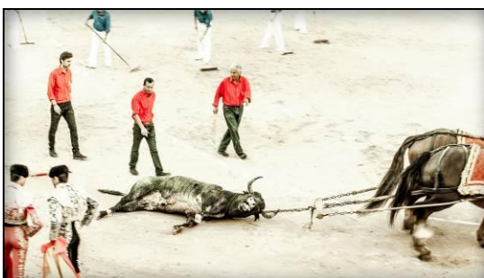
Après la mise à mort, la dépouille du taureau est tirée hors de l'arène avec un train d'arrastre (deux chevaux tirent une chaîne à laquelle le corps du taureau est attaché par les monosabios, les hommes en chemise rouge).