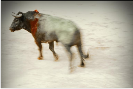
Taureau au cou ensanglanté mais toujours debout.