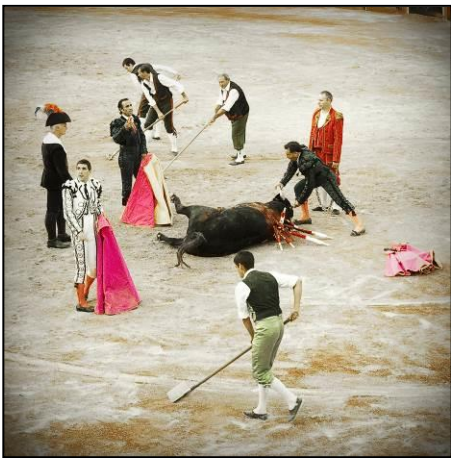
Taureau venant de recevoir l'estocade finale. Les areneros commencent à nettoyer la piste pour le combat suivant où un autre taureau sera tué.