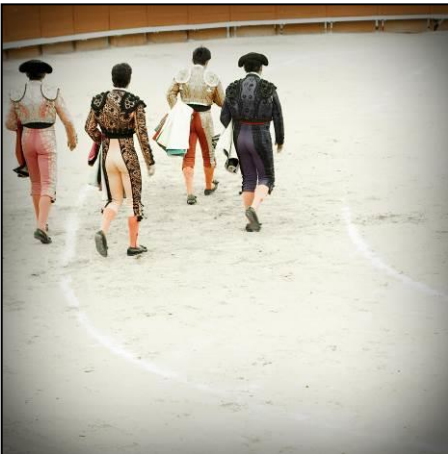
Toréadors marchant de dos dans l'arène.