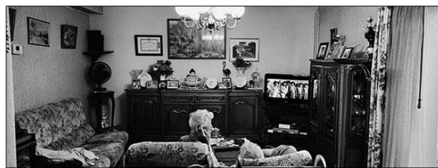
« La blancheur des cheveux de ma grand-mère qui dépassent du fauteuil enraciné devant la télévision est déjà un souvenir. Le fauteuil lui-même va bientôt disparaître, mon grand-père veut changer de maison suite à l'hospitalisation de sa femme atteinte de la maladie d'Alzheimer. Dans le même temps, sa sœur qui vit en maison de retraite a perdu la tête il y a un mois, sa vivacité a laissé place à la démence... » Bergerac, Juillet 2014