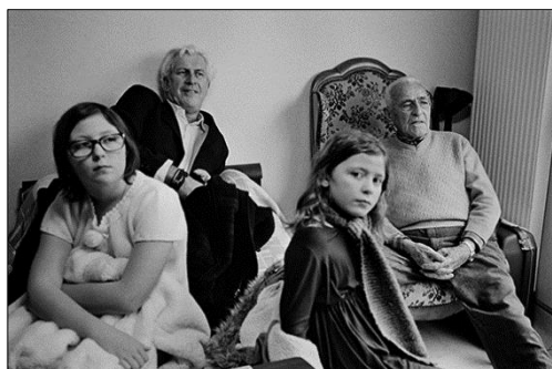
« Depuis hier mon père est là avec ses filles, sa femme, mes sœurs et la chienne. Sa meute, dont il se comporte comme le chef avec la grosse voix et l'opinel qui frappe le bout de la table. Plus le temps passe, plus je m'aperçois de notre différence générationnelle. Accompagner la fin du grand-père c'est aussi se repositionner face au père... » EHPAD, chambre 5 / 21 août 2016