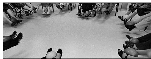
EHPAD, Octobre 2015