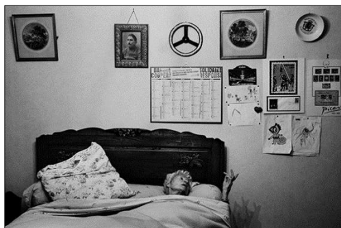
« Au cours de l'été 2014, ma grand-mère et ma grande tante ont eu des complications de santé... » Bergerac, Juillet 2014