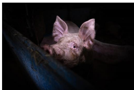
Dans les ténèbres d'un hangar, parmi ses 500 congénères, un cochon épie un rayon de lumière lors d'un beau matin d'été. Pologne.