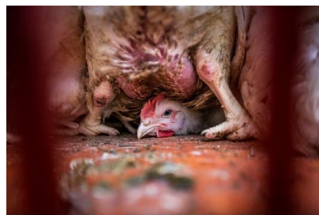
Vue à l'intérieur d'un transport surpeuplé de poulets destinés à l'abattage pour être grillés. Pologne.