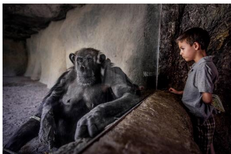
Des cousins mais pas des égaux : un hominidé libre regarde un hominidé en captivité et commence à comprendre que les chimpanzés devraient être considérés comme des personnes. Mexique.