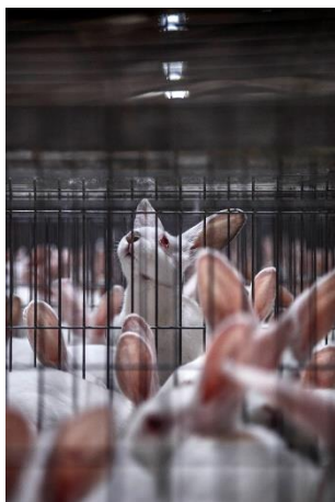
Sans issue. Le regard d'un lapin parmi des centaines d'autres entassés dans des cages en métal. Espagne.