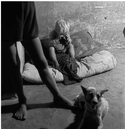
Budapest, Hongrie - 1947