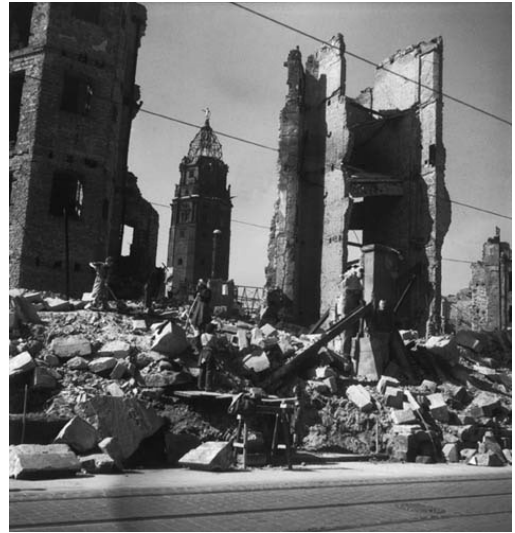
Allemagne - 1945