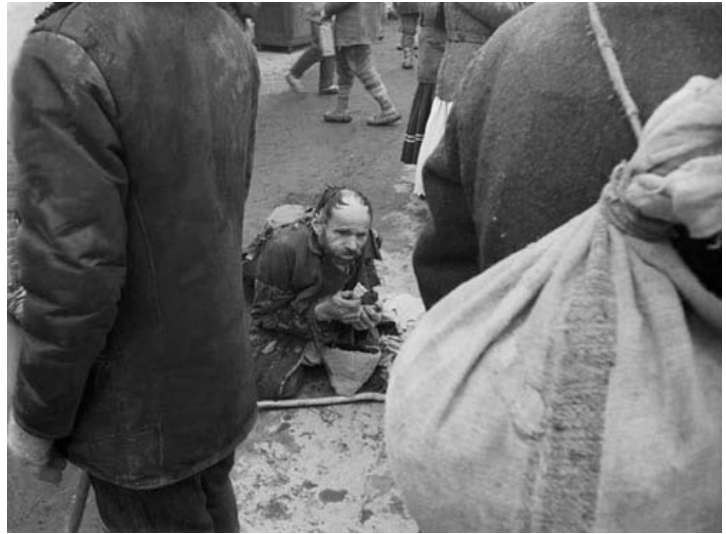
Village de Homorod, Roumanie -1947