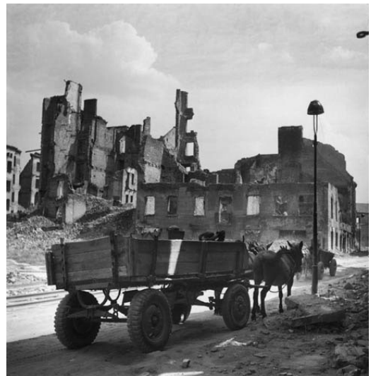
Varsovie, Pologne -1948