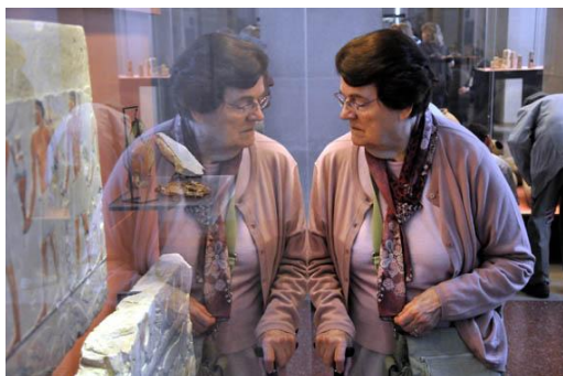
Musée du Louvre, Paris. Juin 2012