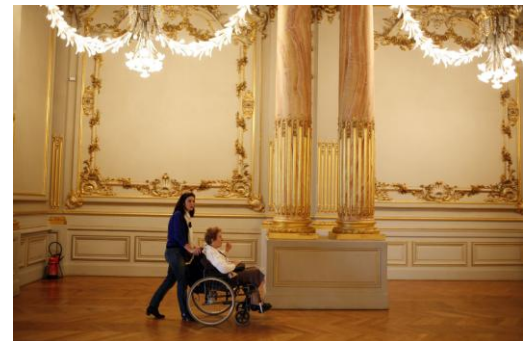
Musée d'Orsay, Paris. Septembre 2012