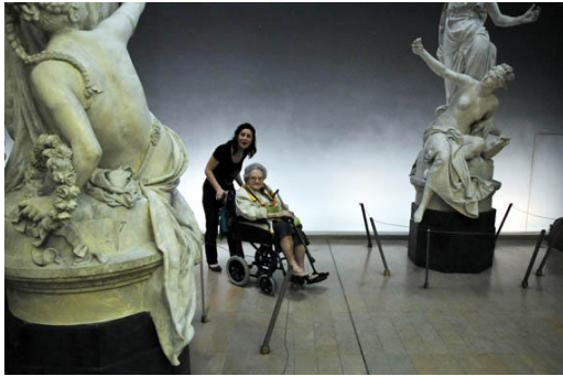
Musée d'Orsay, Paris. Juin 2012