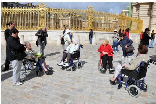
Cour royale, Versailles. Juin 2012