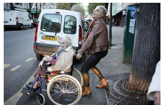
Avenue d'Ivry, Paris. Septembre 2012