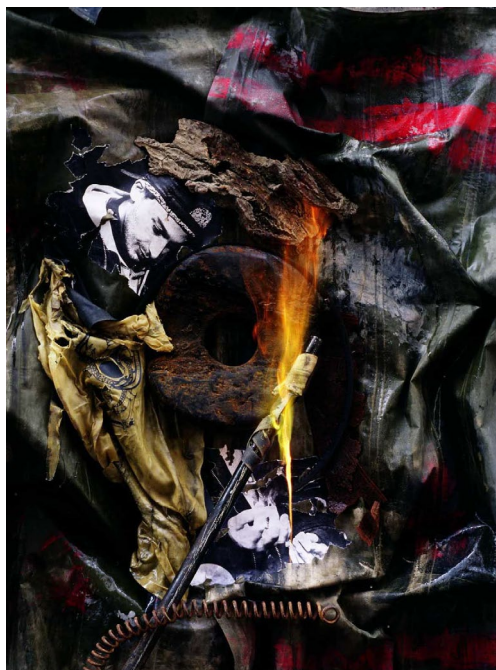
Soitz im Augen